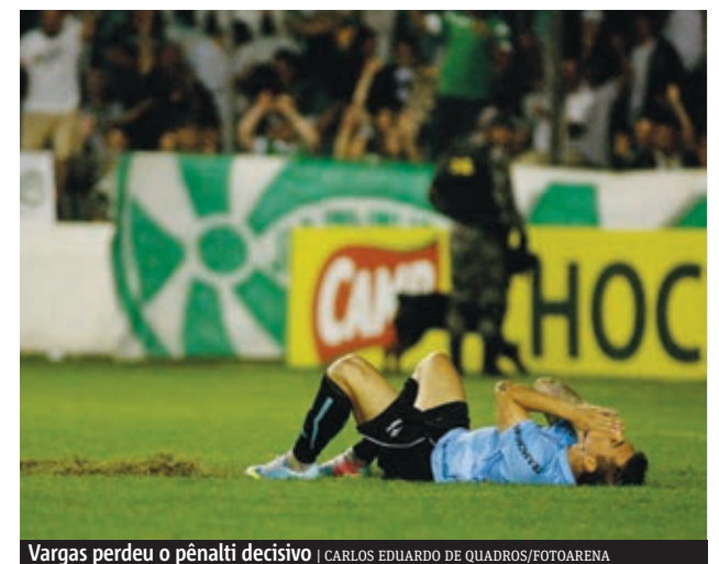
Vargas perdeu o pênalti decisivo